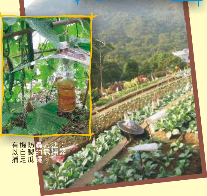
有機防蟲方法： 以自製的誘捕器 捕足瓜蠅。