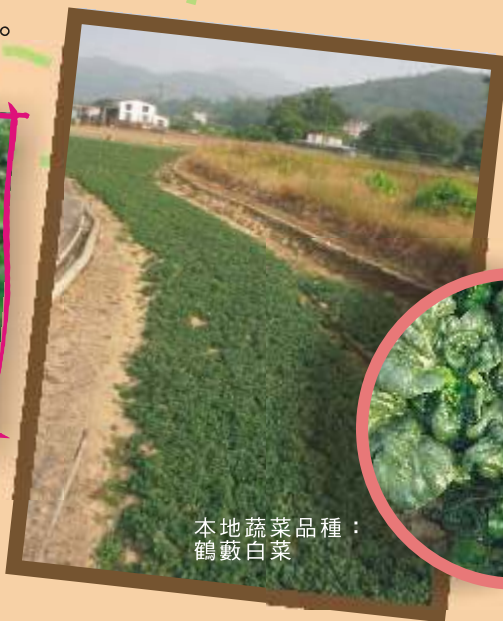
本地蔬菜品種： 鶴數白菜