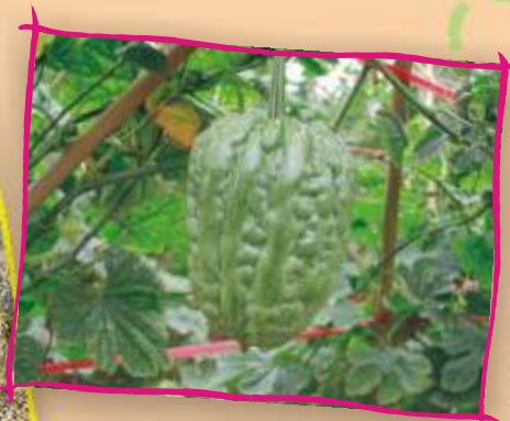
本地蔬菜品種：雷公鑿苦瓜