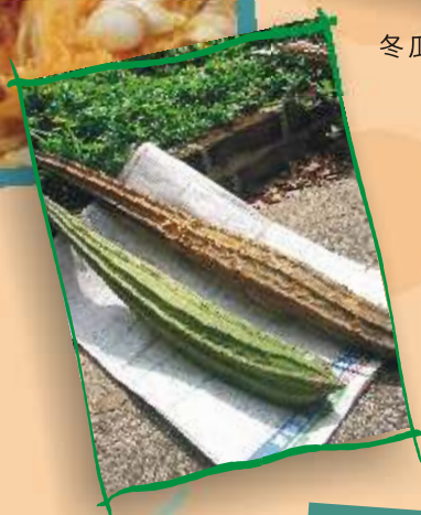
留種用的絲瓜。其中 右邊一條已經完成風 乾過程，可以收集瓜 內的種子了