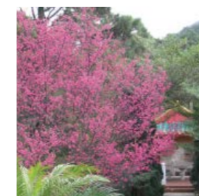
胡挺生先生紀念亭盛放的鐘花櫻桃 Taiwan Cherry blooming at the T.S.Woo Memorial Pavilion