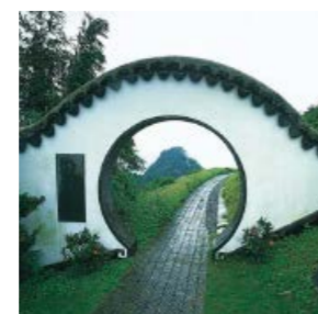
通往嘉道理兄弟紀念亭的月形拱門 The moon gate entrance to the Kadoorie Brothers Memorial Pavilion