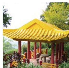
黃金亭 Golden Pavilion