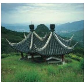
嘉道理兄弟紀念亭 The Kadoorie Brothers Memorial Pavilion

請到訪本園上山區 Please also visit the Upper Area of KFBG