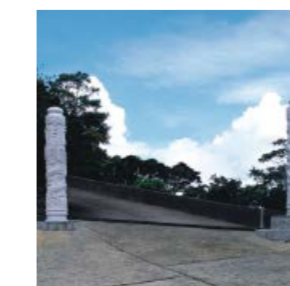
龍鳳柱擎天而立 Dragon & Phoenix Pillars against the sky

此圖並非按比例繪畫 This Map is Not Drawn To Scale